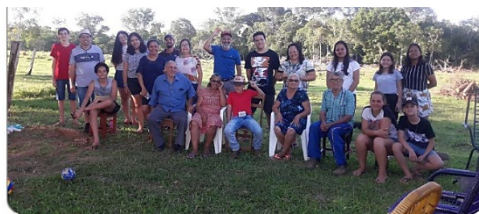
Pic-nic das igrejas de S. Felipe d'Oeste & Pimenta Bueno

Durante esses anos aqui no Brasil, temos trabalhado juntos semanalmente através da internet, tanto com os irmãos indianos, quanto com os irmãos em Moçambique. Ao mesmo tempo estamos plantando uma igreja em São Felipe do Oeste – Rondônia.